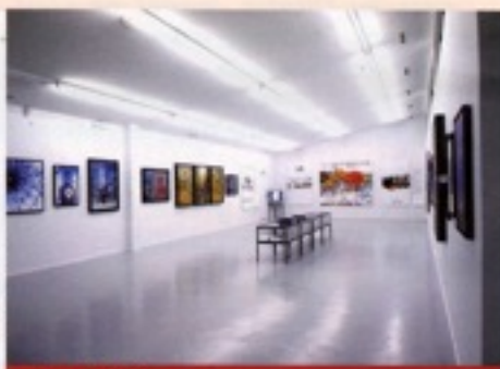
La ville à l'honneur

Complète et très bien documentée, cette exposition permettait de revenir sur l'ensemble de l'œuvre de cet artiste engagé et sensible.